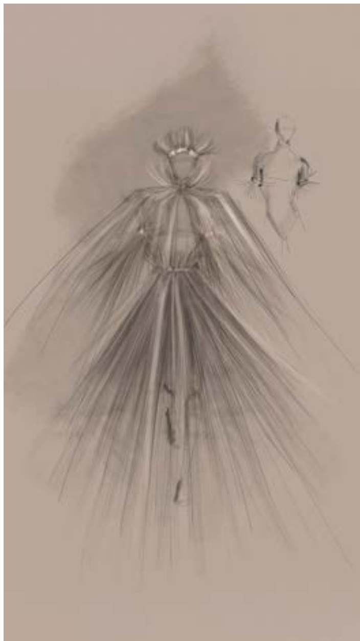
Bozzetto costume per Cirque du Soleil - Federica Pochini