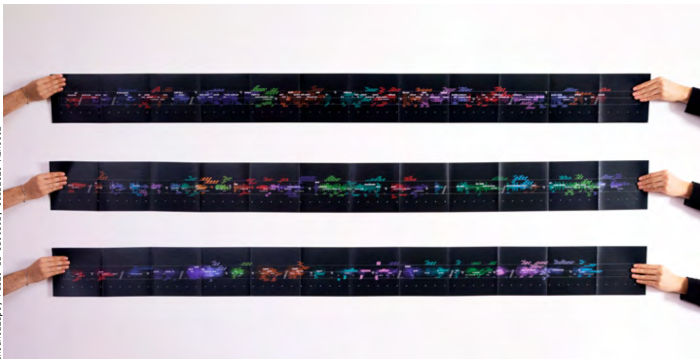
Generative design - Marco Taurino